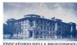
EDUCATORIO DELLA PROVVIDENZA